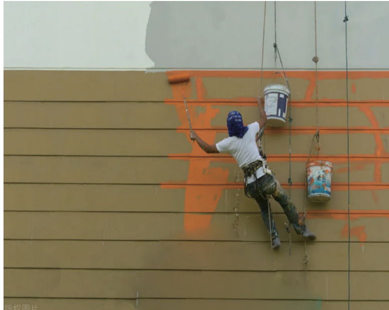
国外油漆工正在刷漆