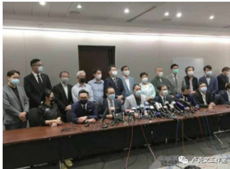
反对派集体宣布辞职

在法律界，香港动乱时的旧账开始一笔笔清算，2019年11月在上水用砖头砸死70岁罗伯的两名男子，