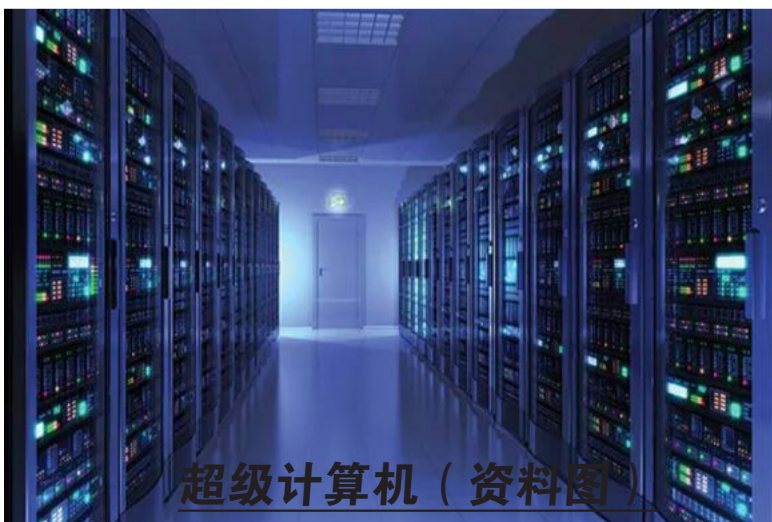
超级计算机(资料图)