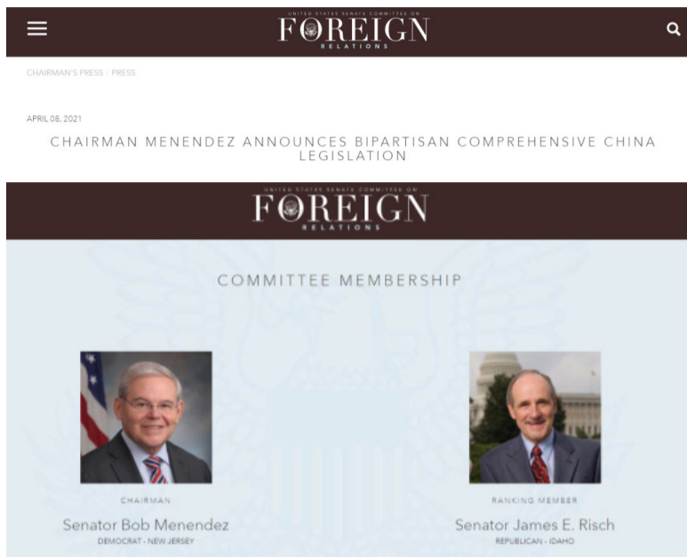
提案人梅嫩德斯(左)和里施(右)

中知名的“友台派”,这样的建议也呼应了特朗普政府时期的某些做法,大概是想凝聚两党共识。