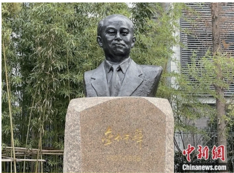
金仲华雕像在上海国际问题研究院揭幕

今年4月1日是杰出的新闻工作者、国际问题专家、著名社会活动家、人民外交家、中国新闻社首任社长金仲华先生诞辰114周年。