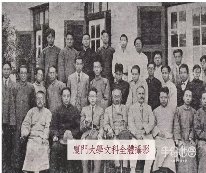
廈門大學文科全體攝影