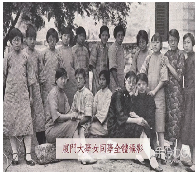
廈門大學女同學全體攝影

当时厦大分有文科、理科、教育科、商科、法科等科系，当年招收新生152名。 1929年6月第四届毕业典礼，共有48名学生毕业。 校长为主掌私立厦大16年之久的新加坡著名华侨林文庆（厦门大学文科全体摄影正中）。