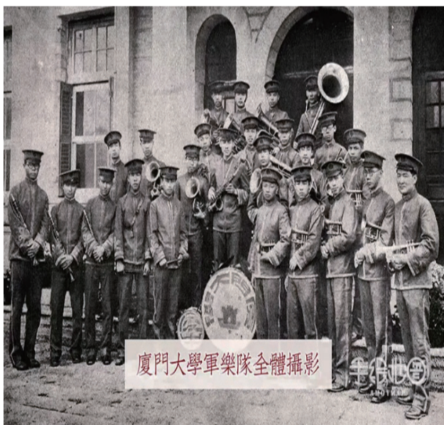
廈門大學軍樂隊全體攝影

当时厦大学生的文体活动已经相当丰富，有足球队、篮球队、网球队、排球队（排球）、军乐队、吟诗班等。运动队有专门的比赛队服。队服跟卫衣上可见当时厦大的英译AMOY UNIVERSITY，简称AU。现在我们时兴的文化衫，厦大在92年前就有了。