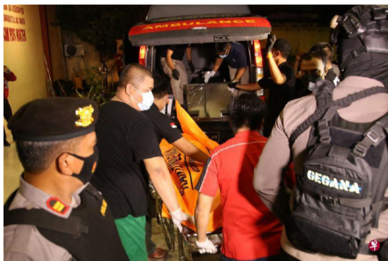
击者都是亲伊国组织告，接下来可能还会发生更多袭击事件。 的极端组织神权游击队成员。警方事后警 联合早报

上个星期天发生的天主教堂恐袭案造成至少20人受伤，发动袭击的一对新婚夫妇当场被炸死。根据警方调查，这两名袭