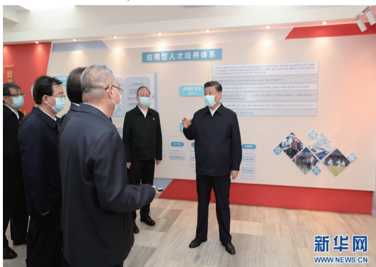
这是25日上午，习近平在福州闽江学院，参观校史和应用型办学成果展示。