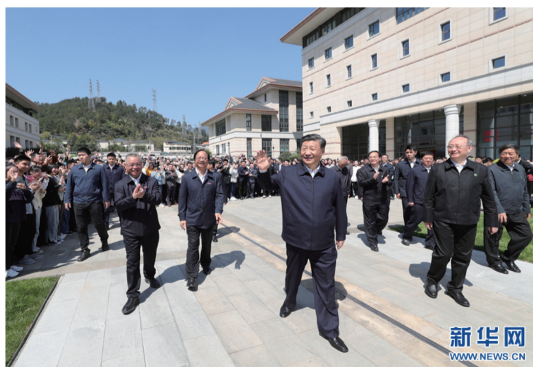
这是25日上午，习近平在福州闽江学院考察时，向师生们挥手致意。