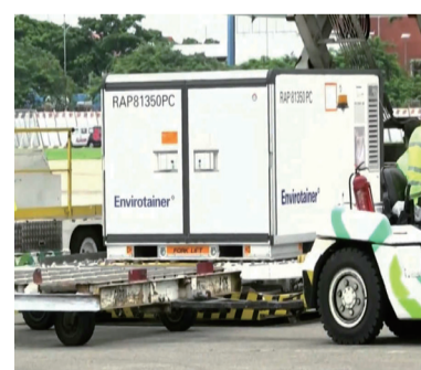
中国科兴疫苗1600剂到达印尼，军队保护送到万隆国营药厂加工后分发全国。

府全力以赴开展接种疫苗工作，争取在今年七月已完成种植疫苗超过七千万人，目前担心的是疫苗供应来源不足，特别是欧盟国家已决定必须先供应其成员国，暂时禁止出口，美国也有此倾向，这对印尼和东盟国家都有一定的影响，印尼必须加大与中国的合作，确保来源有确切可靠。（李全）