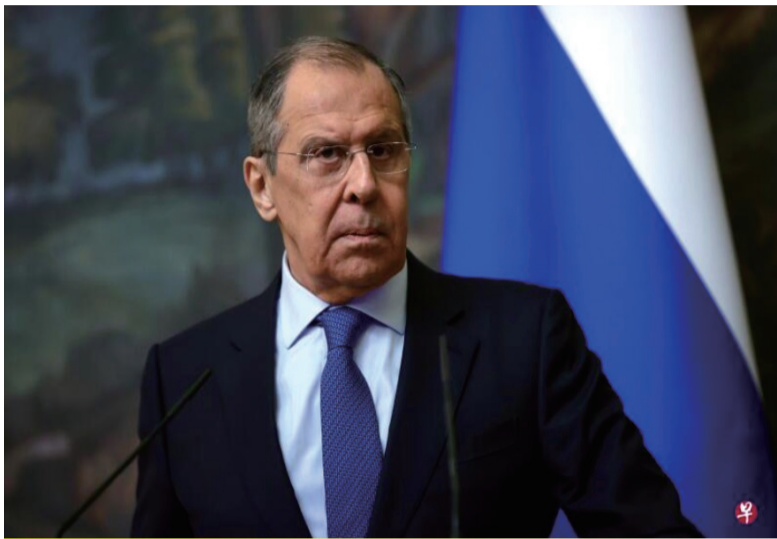
俄罗斯外长拉夫罗夫今天将开启访华行程。图为拉夫罗夫本月17日在莫斯科与以色列外长会晤后出席新闻发布会。

意味着中俄意欲加强紧密关系甚至联手反制美国；但也有观点指出，这是中俄作为全面战略合作伙伴之间的正常外交活动，中俄合作秉持不结盟、不针对第三方的原则。