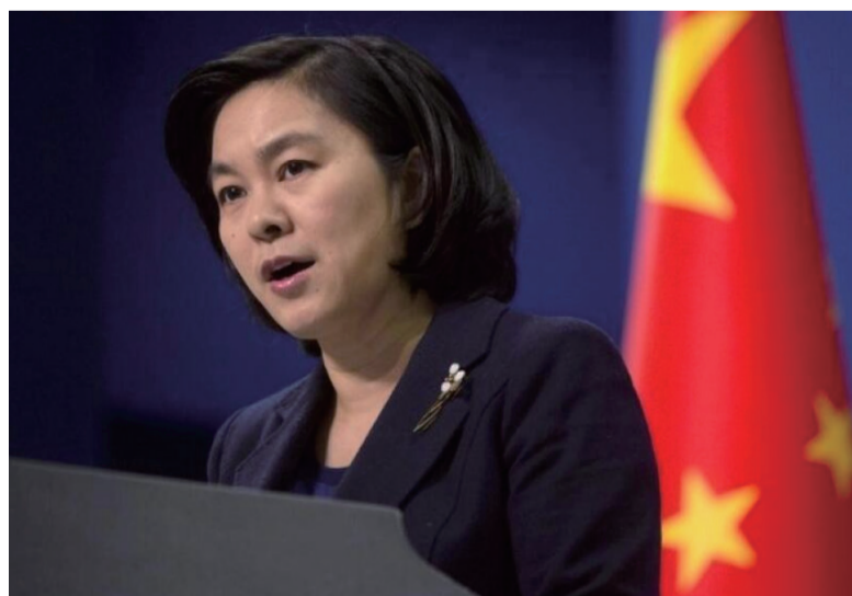
中国外交部发言人华春莹说，中俄关系的发展，不针对任何特定的国家。