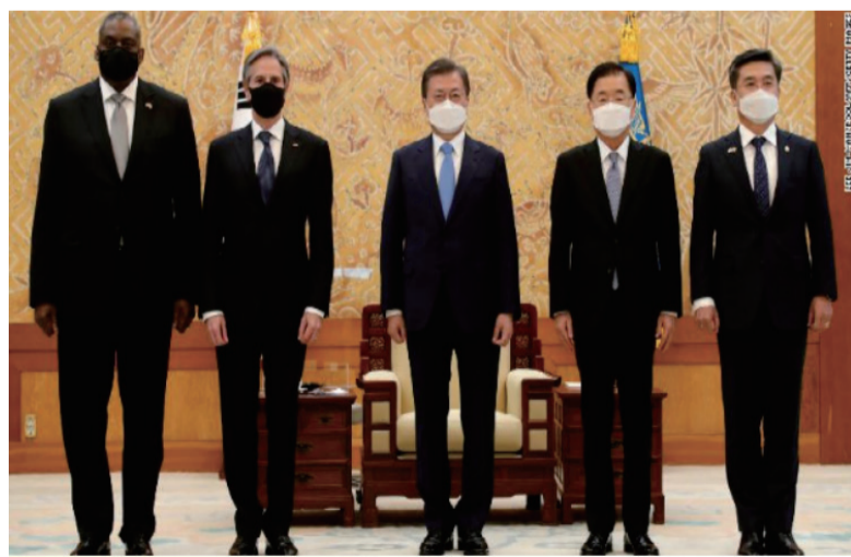
阿拉斯加会谈之前，美国政府分别出访日本、韩国举行“2+2”会谈，图源：Kim Kyung-Hoon/Pool Photo via AP/CNN