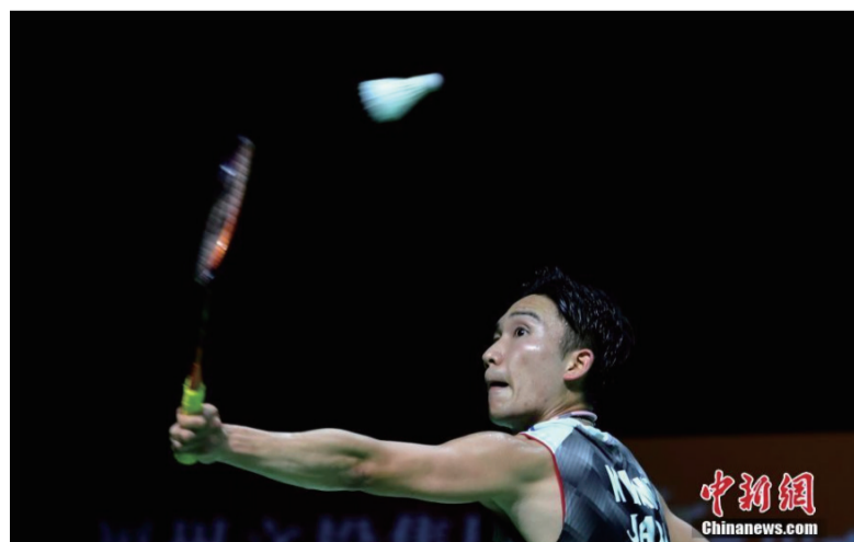
资料图：桃田贤斗在比赛中。

本届赛事中，中国队、韩国队没有报名参赛，来自中国台北的戴资颖、周天成和西班牙名将马林等也在赛前选择退赛。