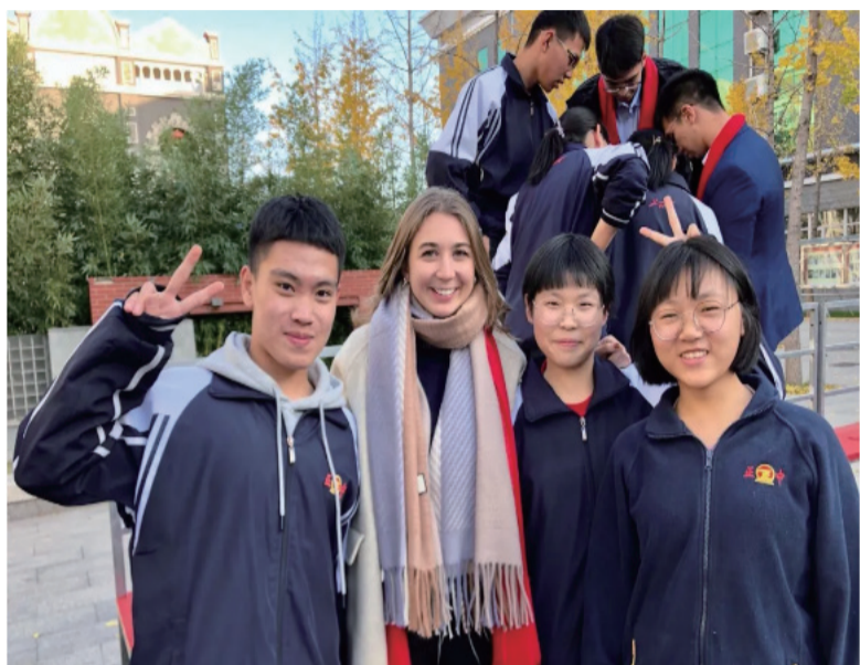
图为莫里森2019年在河北。她从高中开始学习中文。