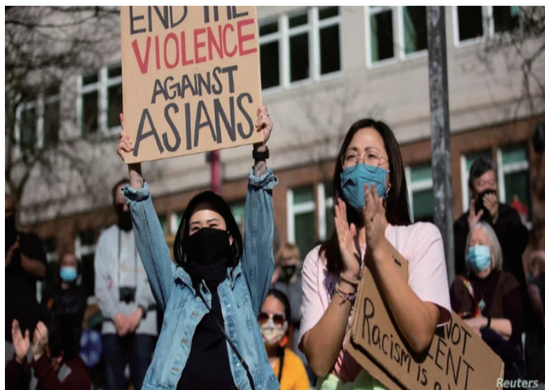
西雅图民众呼吁终止仇恨亚裔

当地时间3月16日，美国佐治亚州首府亚特兰大市内和周边地区按摩店接连发生三起枪击事件，8人不幸身亡，其中6名是亚裔女性。