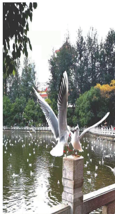
卿卿我我兮翠湖会,红红脚爪兮芭蕾美!