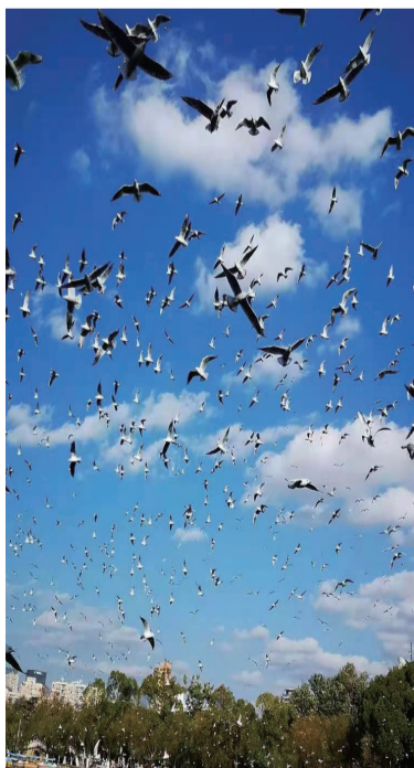
蓝天白色纷飞的精灵,湖上鸣唱温馨的诗情!

翠湖成了红嘴鸥的家园,不来这里看精灵,对生活在春城者或者来访春城者,都是一种遗憾。你来了,精灵让你陶醉。你爱上她们,有时间就去看望她们,回到家里,一定会唱一首暖心的歌,或者在睡梦中笑出红嘴鸥咕咕的声响。