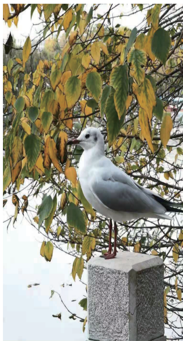
神采奕奕,玉立亭亭,翠湖之滨,精彩风景!