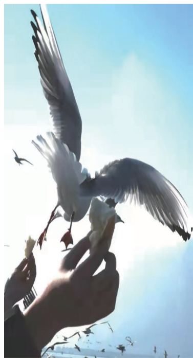
玉手送爱心,美姿迎温馨。