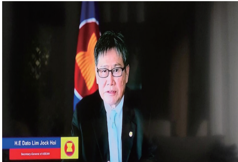
东盟秘书长林玉辉