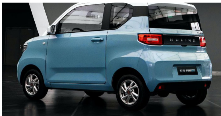
帽五菱电动汽车仅售65百万盾

棉兰市长) 结婚时，凯杉与丽霞两人都穿着传统爪哇服装出席婚礼，当时，菲丽霞身穿爪哇传统红色衣裙，凯杉也是全身传统爪哇绿色男装，十分引人注目，众人皆知是一对年轻情侣，佐科维总统的次子和未来媳妇。(见图片)如今情况确实令人感到震惊和不解。