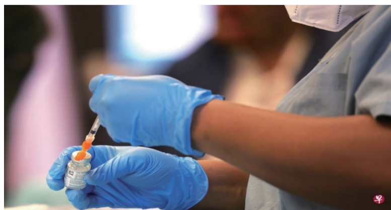
美国国防部官员证实,美国有八成的针头和注射器来自中国。

卡明斯表示,国防部正利用《国防生产法》和《经济法》加大对针头和注射器的生产投资,以解决医疗用品供应不足、只能依赖进口的问题。