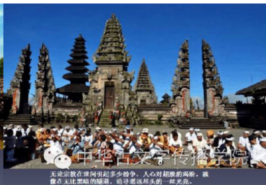
无论宗教在世间引起多少纷争，人心对超脱的高尚，就像在无比黑暗的夜晚，追寻着那一点光亮。

人还崇尚祖先崇拜，古今中外许多有影响的人物和传说中的人物也都成为他们崇拜和尊奉的对象，如孔子、关羽、郑和、财神、钟魁等。此外，来自不同地区、通行不同方言、从事不同行业的华人群体又各自信奉特殊的神灵，也是华人社会四分五裂的原因。如客家人信奉大伯公，闽南人信奉妈祖，海南人信奉天后娘娘，木匠尊奉鲁班祖师等。印尼虽然是个宗教多元化的国度，然自十九世纪末，伊斯兰教逐渐在印尼社会中占取了绝对的优势。印尼独立后，由于得到印尼政府的扶持和鼓励，伊斯兰教在印尼社会中的影响更是急遽扩张，上升为占统治地位的宗教。伊斯兰教是一个排他性较强的宗教，其教义的核心是只能信仰安拉，“除安拉外，别无神灵。”自然也无法包容华人所信奉的众多神灵，故而成为诱使印尼社会中排华骚乱爆发的一个极为敏感的潜在因素。