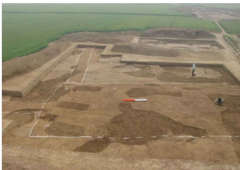
二里头遗址宫城西墙和8号基址。

夏朝是否是古人臆测出来的朝代？“大禹治水”是美好传说还是确有其事，相关争议一直存在。但河南偃师二里头遗址的发现揭开了古老“夏都”的神秘面纱，如今二里头遗址为夏朝中晚期都城遗存已逐渐成为学界共识。这个遗址到底有何特殊之处？它对佐证夏朝存在有何帮助，又是为何被认定为夏朝