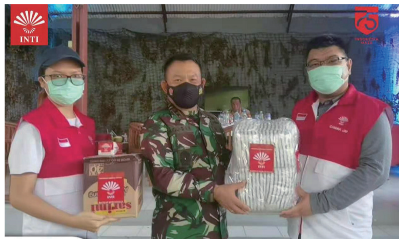
华裔总会捐助救灾物品给雅加达军区救灾处

印尼华裔总会昨日向受灾灾民发放大批食物和衣服援助救灾, 但华裔总会把捐助物品捐给雅加达军区司令部求灾处, 由军方接收, 军方发言人对此大表赞赏。(李全)