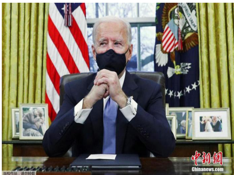
图为美国总统拜登在华盛顿白宫椭圆形办公室签署行政命令。

宣称“美国回来了”，美国要重新领导世界。“可以说此次G7视频会议是拜登非常需要的一次机会，以告别所谓‘G6+1’，进一步修复与盟友之间的关系，形成更加坚强的同盟体系，摆脱特朗普政府留下的‘负资产’。”