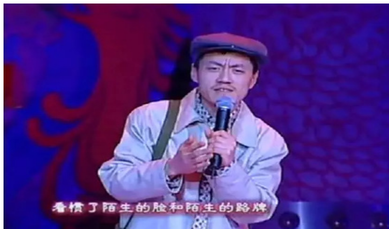
▲ 2002年央视春晚，雪村登台演唱歌曲《出门在外》