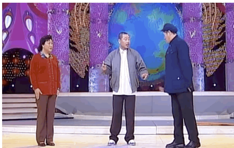
▲ 2002年央视春晚 赵本山、范伟、高秀敏搭档出演小品《卖车》 “树上骑个猴，地上一个猴，加一起俩猴”