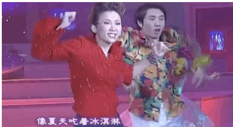
▲ 2001年央视春晚，26岁李玟演唱《好心情》