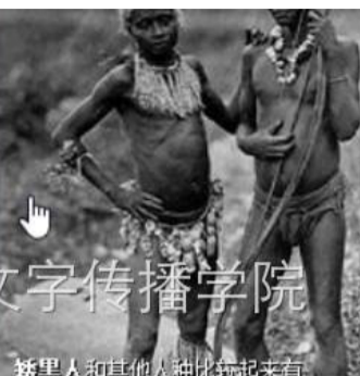
1.3 的 系 连 链 黑 人 系

岛语族最早起源的地区的一部分；向上追溯前3000—2000年所得的大坨坑文化很可能是原南岛语族的代表或一部分的代表；隔着台湾海峡的富国墩文化如果可以进一步的证明是大坨坑文化的一部分，那么原南岛语族的老家便推上了大陆的东南海岸；照目前的材料看，这批材料的地理范围集中在闽江口到韩江口的福建和广东东端的海岸”。