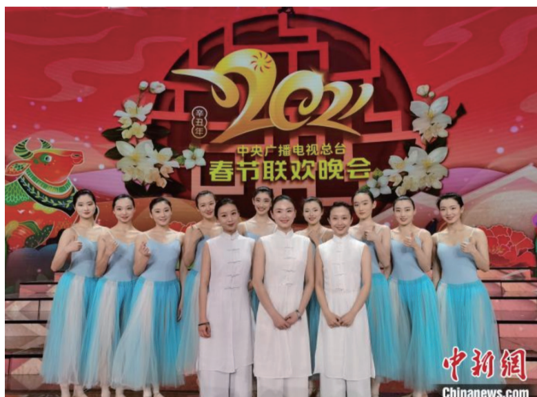
参与2021年春晚节目《明天会更好》演出的残疾人艺术团成员。

日本最大的视频平台Niconico同步转播总台春晚节目，引发日本民众积极反响，实时在线观看人数9.74万人。在非洲，有5.64万观众通过多个当地有线网络直播收看了春晚。