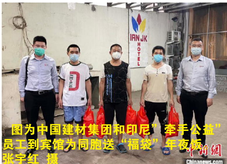
图为中国建材集团和印尼“牵手公益”员工到宾馆为同胞送“福袋”年夜饭。