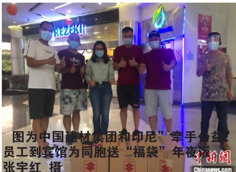
图为中国建材集团和印尼“牵手公益”员工到宾馆为同胞送“福袋”年夜饭。