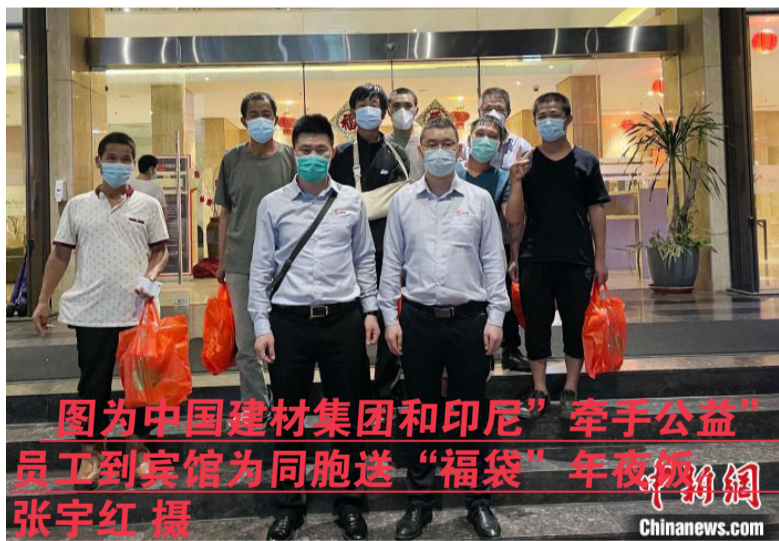
图为中国建材集团和印尼“牵手公益”员工到宾馆为同胞送“福袋”年夜饭。