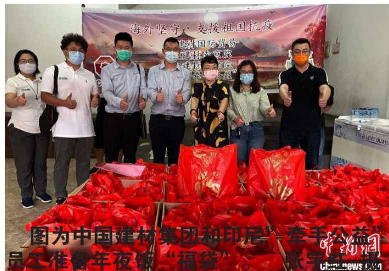
图为中国建材集团和印尼“牵手公益”员工准备年夜饭“福袋”。