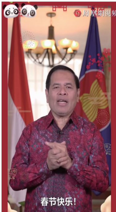
印度尼西亚驻华大使周浩黎为全球华人送上新春祝福

在疫情的考验下，世界各国经历了不同寻常的一年，全球人民的心更加紧密。同一个世界，同一个新年。在春节来临之际，环球网策划制作“驻华大使最牛拜年”系列视频，走访各国驻华大使馆，为全球华人送上新春祝福。各国驻华大使就抗疫合作、传统节日及其他热点问题接受环球网记者采访。印度尼西亚驻华大使周浩黎表示疫情期间两国互帮互助，彰显“患难见真情”，期待在2021年两国有更好的合作。