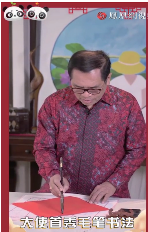
大使首秀毛笔书法