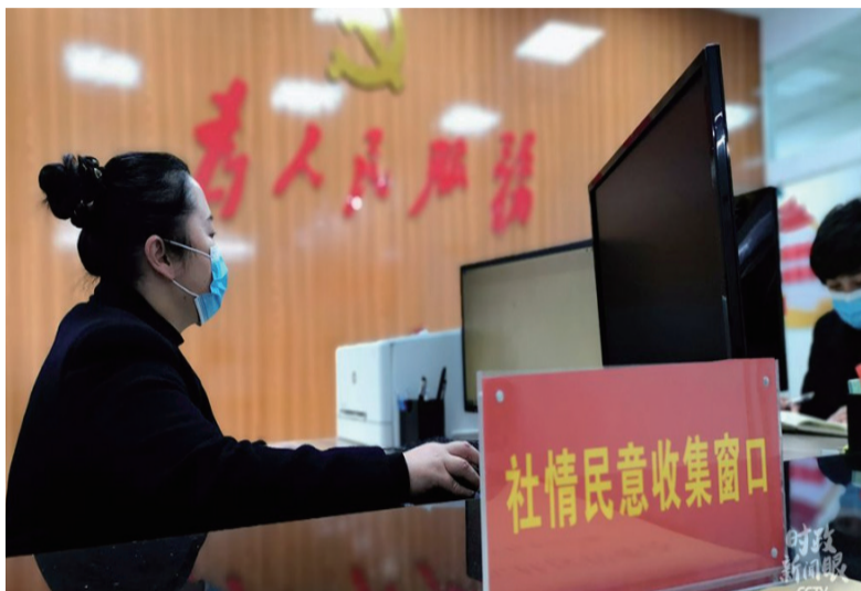
金元社区便民服务中心