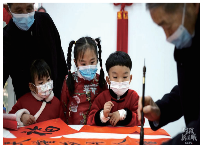
金元社区居民活动室内， 孩子们观摩书法写作。

生态文明贵阳国际论坛是中国以生态文明为主题的国家级论坛，也是贵州的另一张国际名片。2013年和2018年，习近平主席