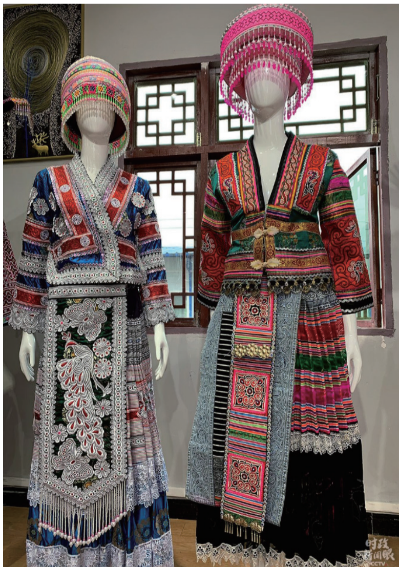
歪梳苗服饰

为减少疫情传播风险，今年提倡就地过年。总书记在考察期间强调，各地区各部门要做好就地过年