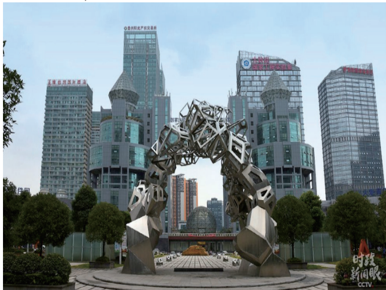
国家大数据产业技术创新贵阳试验区。 2015年，总书记曾来到大数据应用展示中心调研。

贵州还有另一张创新名片——“中国天眼”。它是目前世界上最大的单口径射电望远镜，口径达500