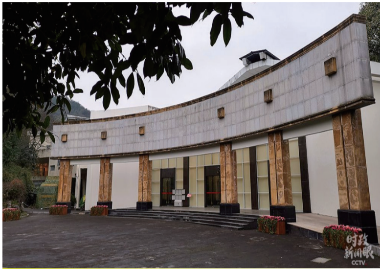
当天的汇报会在这里举行。