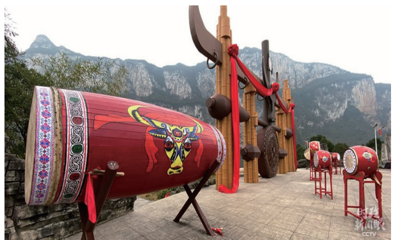
化屋村文化广场，牛角是苗族图腾之一。 (总台央视记者张宇、李辉拍摄)