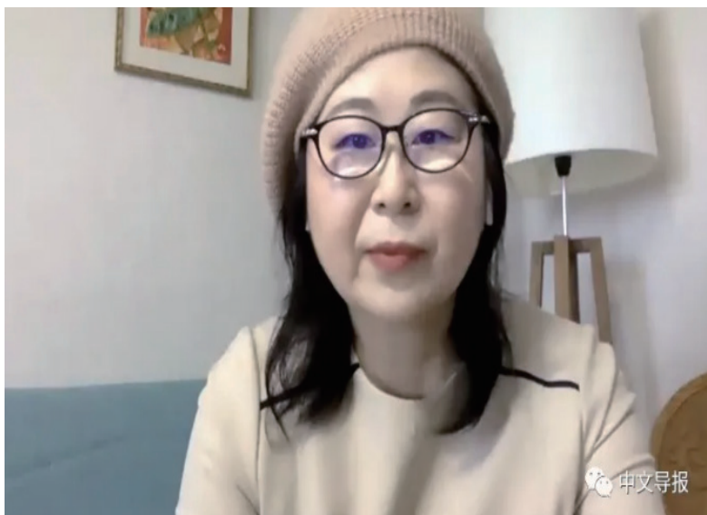
日本华文女作家协会华纯会长