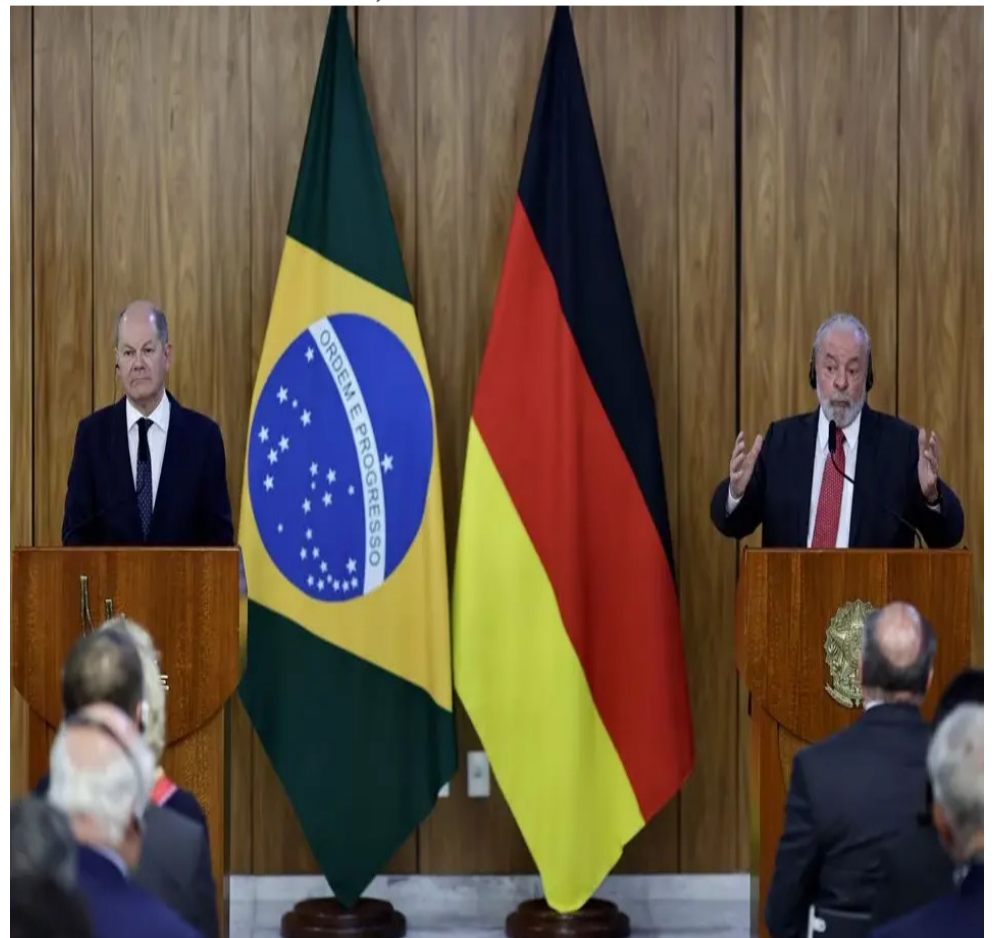
朔尔茨和卢拉出席联合记者会