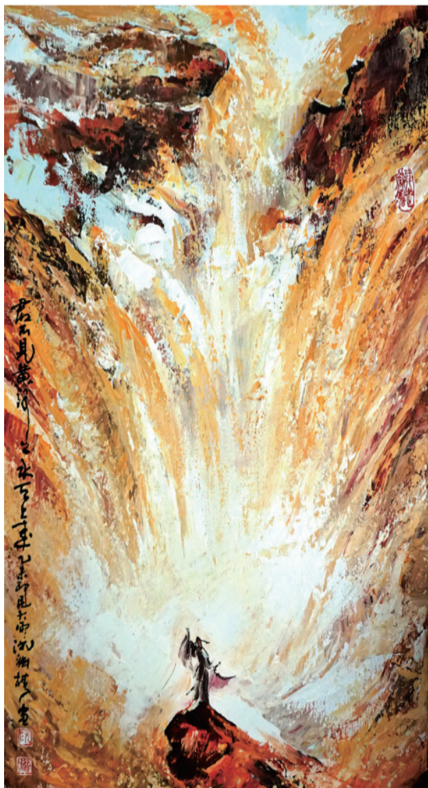
阮渊椿-李白将进酒 (油画)