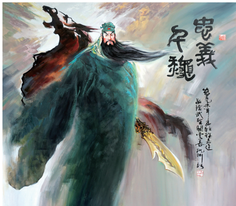
阮渊椿-忠义千秋 (油画)