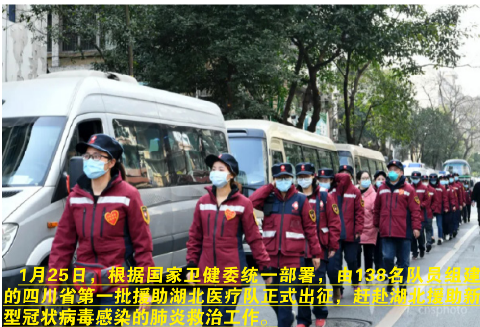
1月25日，根据国家卫健委统一部署，由138名队员组建的四川省第一批援助湖北医疗队正式出征，赶赴湖北援助新型冠状病毒感染的肺炎救治工作。