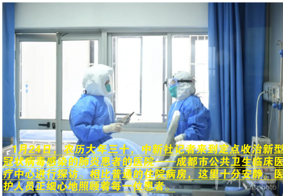
1月24日，农历大年三十，中新社记者来到定点收治新型冠状病毒感染的肺炎患者的医院——成都市公共卫生临床医疗中心进行探访。相比普通的住院病房，这里十分安静。医护人员正细心地照顾着每一位患者。