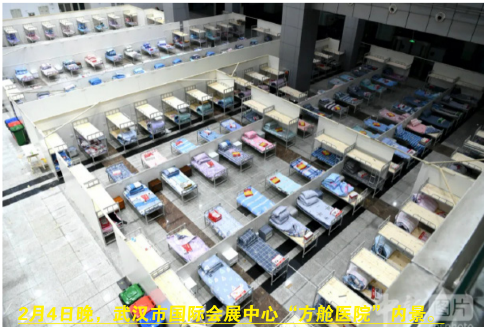
2月4日晚，武汉市国际会展中心“方舱医院”内景。