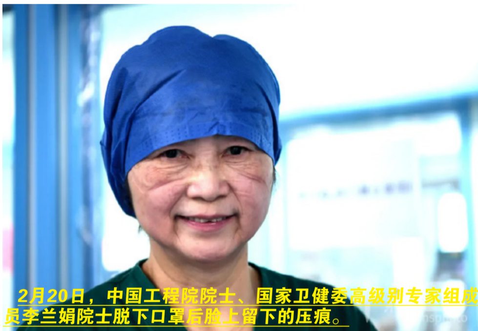
2月20日，中国工程院院士、国家卫健委高级别专家组成员李兰娟院士脱下口罩后脸上留下的压痕。

编者按： 今天向大家隆重推荐小牛的一位资深摄影同事——中新社四川分社记者安源。2020年1月27日，农历大年初三，安源从成都“逆行”前往武汉支援采访报道。2月20日，安源和同事获得独家采访李兰娟院士在ICU病房查房的机会，查房结束时，李兰娟院士下意识露出微笑，面部压痕清晰可见。安源意识到李院士的笑容对全国人民来说是莫大鼓舞，举起相机抓拍下这一珍贵瞬间。这张照片刊发后，在社交媒体上迅速刷屏，数万网友留言点赞，人民摄影报社副总编辑贾晓霞评价说：“这张照片有直击人心的力量。” 以下为安源2020年武汉战疫报道作品选：