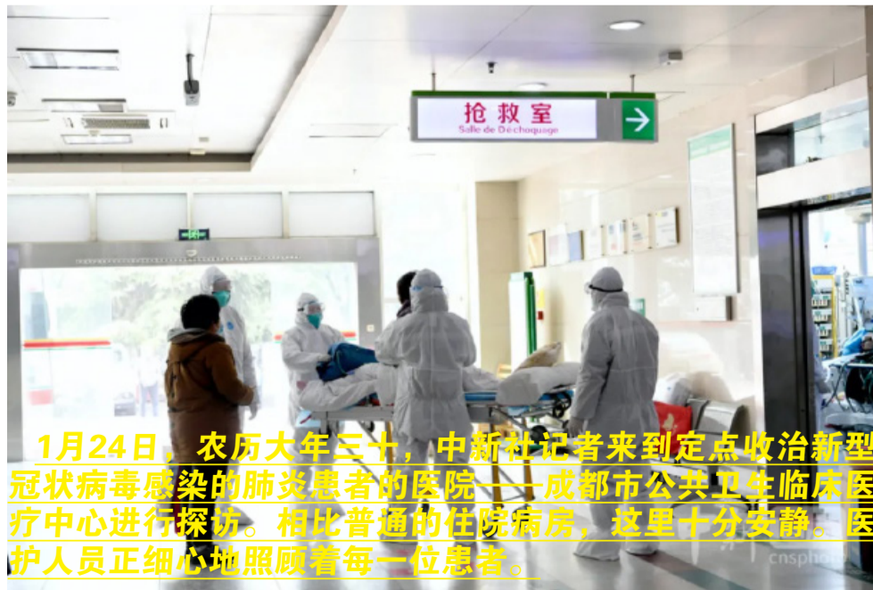
1月24日，农历大年三十，中新社记者来到定点收治新型冠状病毒感染的肺炎患者的医院——成都市公共卫生临床医疗中心进行探访。相比普通的住院病房，这里十分安静。医护人员正细心地照顾着每一位患者。