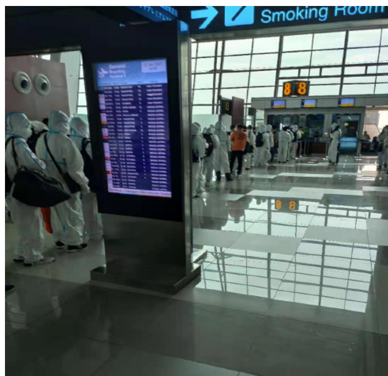
大家每个人都穿着防护服排队检票

行检测。在雅加达的检测地点的工作人员都是华侨或者都会说一些简单易懂的中文的印尼人。所以在很多不会印尼语的中国同胞在沟通上根本没有障碍。到达地点，先是进行排队领取号码，进行检测。现在都是进行双阴性检测，先是喉咙和鼻孔用棉签进行取样，然后进行抽血。工作人员手法娴熟，整个过程很快。（在检测地点有人卖防护服，口罩，防毒面罩等一整套防护装备，很多苦恼无法购买的中国同胞可以在那里购买） 然后就是等检