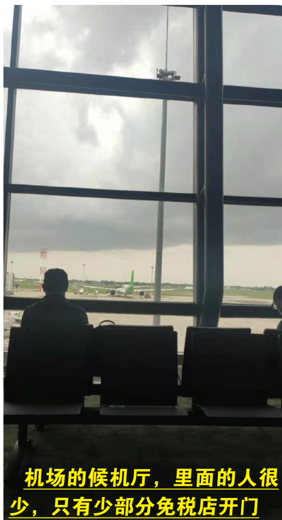
机场的候机厅，里面的人很少，只有少部分免税店开门