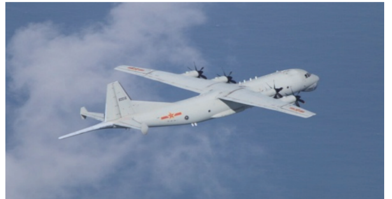
一架中国反潜军用飞机在台湾海峡上空飞行

只是大陆方面解决台湾问题过程中的影响因素之一，但绝非决定性因素。台湾问题是中国内政，解决这件事不能光看别人眼色。民进党当局及绿媒故意将两岸问题扩展为中美问题，高看了自己，小看了大陆。