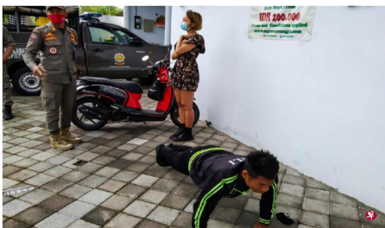
印尼峇厘岛执法人员严格执行戴口罩令，没戴口罩者被罚做俯卧撑，违反防疫条例的外国人可能被递解出境。