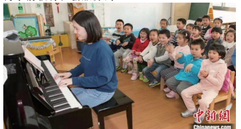
上师大学前教育专业深入幼儿园开展教育教学实践。

高端平台,积极推进上海学前教育现代化。上海师范大学将全力谋划好上海学前教育学院的建设与发展工作。(完)