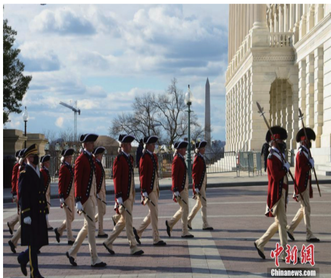
图为1月18日，白宫北侧的观礼台