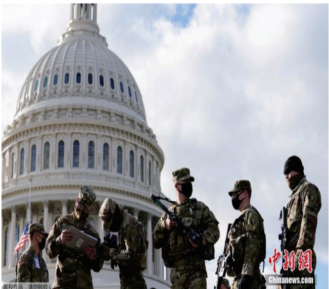
国民警卫队士兵抵达特区 保障就职典礼的安全。