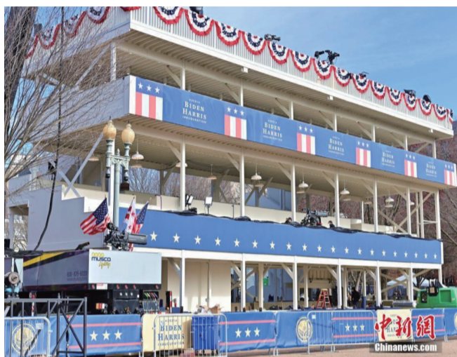
图为1月18日，白宫北侧的观礼台 中新社记者 陈孟统 摄

当地时间1月18日，美国总统就职典礼筹备工作有序进行。美国首都华盛顿特区中心地带的安保措施日趋严密，国民警卫队士兵抵达特区保障就职典礼的安全。 来源：中新网