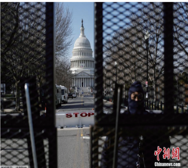
图为国会大厦前的道路 已经封闭。