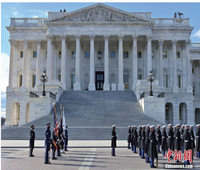
图为1月18日，在国会大厦外彩排的礼兵。