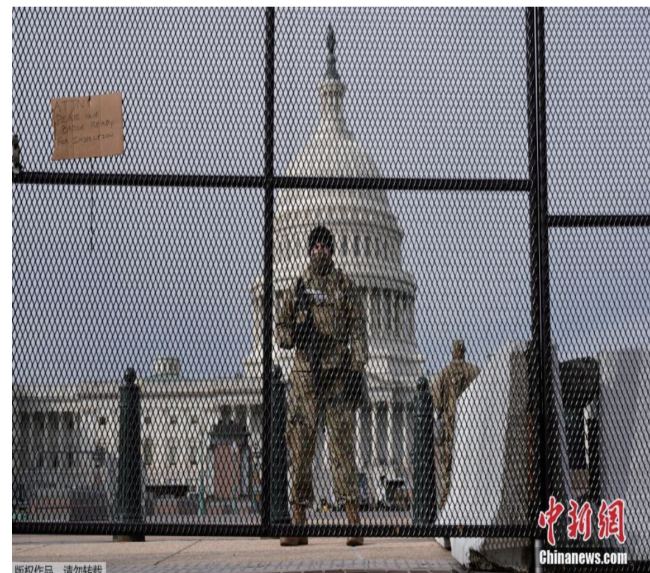
图为国民警卫队士兵 在国会大厦前站岗。