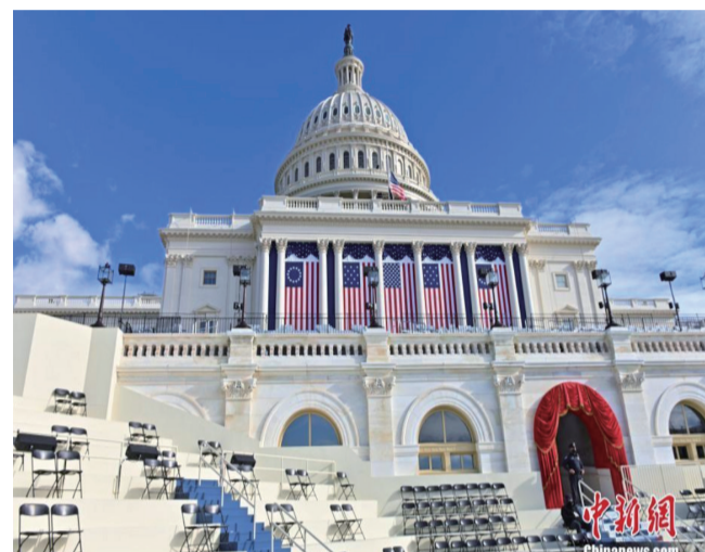
图为1月18日，国会大厦的总统就职典礼礼台。