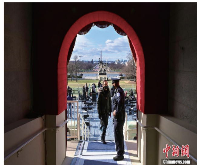
图为1月18日，国会大厦的总统就职典礼礼台。