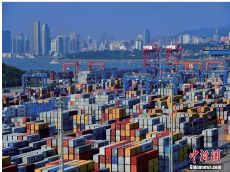
资料图为厦门港海沧集装箱码头。

在过去一年，物价涨幅前高后低。受到疫情影响，2020年1月份CPI同比达到5.4%的高点，后开始