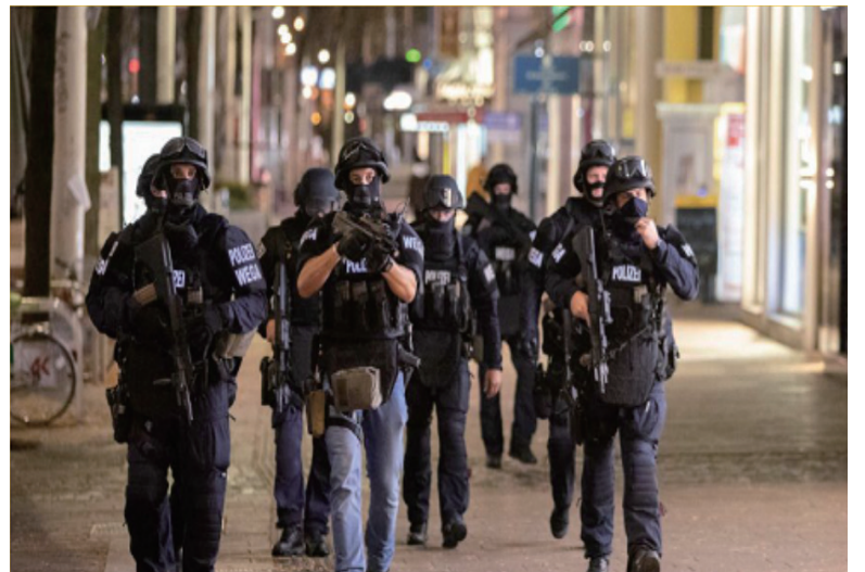
2020年11月2日，奥地利首都维也纳市中心发生恐怖袭击。

一是暴恐势力进入新一轮扩张期。以极端组织“伊斯兰国”为首的国际暴恐势力伺机反扑，死灰复燃之势凸显。尽管“伊斯兰国”在中东遭受重挫，但仍通过各地分支网络在全