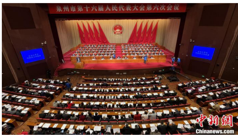
1月16日，泉州市第十六届人民代表大会第六次会议开幕。

作为古代“海上丝绸之路”的重要起点城市，泉州主动融入福建“21世纪海上丝绸之路”核心区建设，成为“21世纪海上丝绸之路”的重要