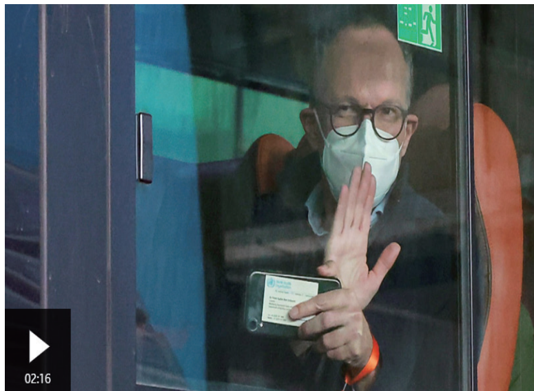
世卫组织专家组抵达武汉,开始调查新冠疫情源头

他说:“我们将继续同世卫组织就相关事宜保持沟通,为双方开展溯源合作共同作出努力。”(完)