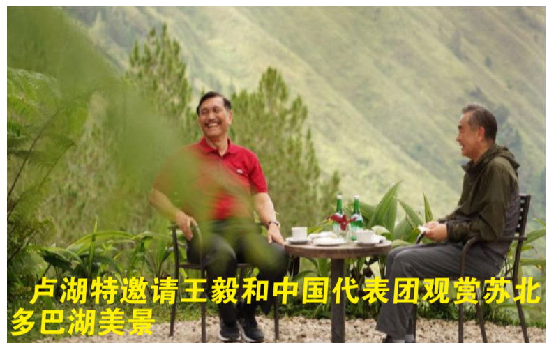
卢湖特邀请王毅和中国代表团观赏苏北多巴湖美景

王毅表示，中方重视印尼在东盟内重要地位和作用，愿同印尼一道，以今年中国—东盟建立对话关系30周年为契机，提升中国—东盟关系水平，打造蓝色经济伙伴关系，推动《区域全面经济伙伴关系协定》尽快生效。中方支持印尼担任2022年二十国集团主席国，愿同印尼共同坚持开放包容的多边主义，捍卫国际公平正义，推进后疫情时期全球治理，体现发展中大