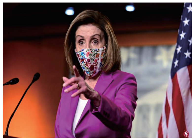
佩洛西说，特朗普是“一个非常危险的人”，绝不能让他继续担任总统。