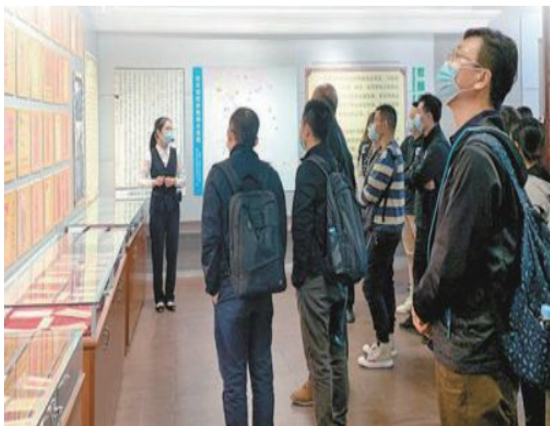
游客在广东汕头侨批文物馆参观。