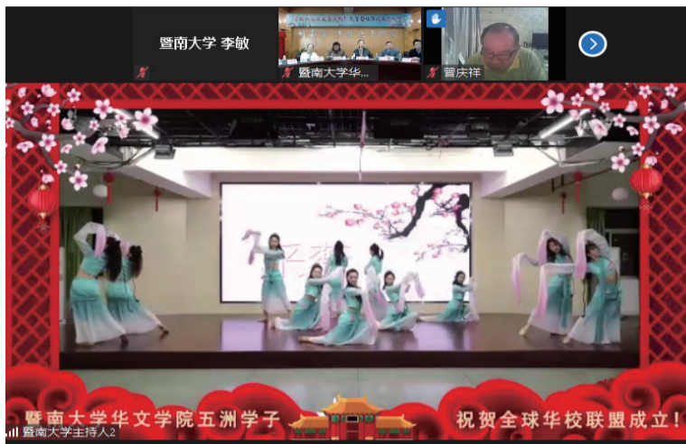
暨南大学华文学院五洲学子 艺术团带来精彩演出