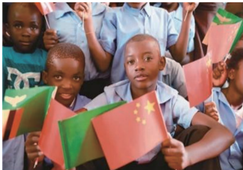
2019年6月13日，在赞比亚卢萨卡省琼圭区，手持中赞两国国旗的儿童参加中国援非“万村通”赞比亚项目竣工仪式。

合作论坛北京峰会成果的收官之年，新一届论坛会议将于今年在塞内加尔举办。据外交部介绍，王毅此访还将就新一届论坛会议筹备事宜同非方交换意见。