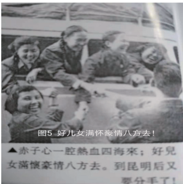
图5 好儿女满怀豪情八方去！