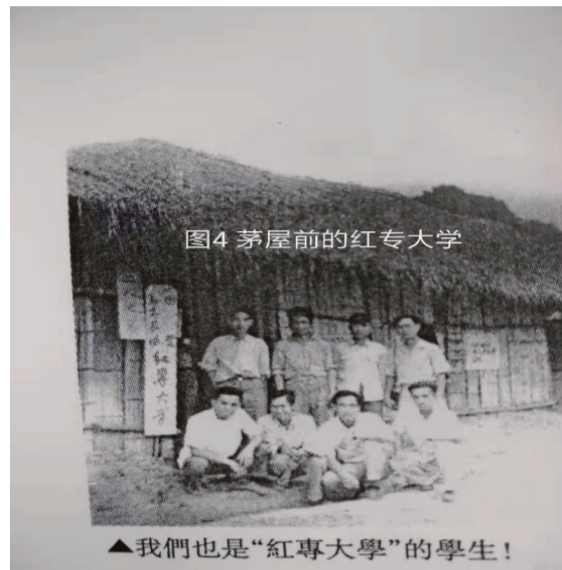
图4 茅屋前的红专大学