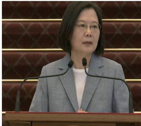
台湾地区领导人卖国求荣 的汉奸蔡英文

台湾“立法院”于2020年12月24日以行政命令的形式，强行批准了一项措施，为开放进口含有瘦肉精（莱克多巴胺）的美国猪肉铺平道路，尽管主要反对党国民党表示反对，称此举会对人民的健康造成风险。但是，立法院内民进党的“议员”占多数，因此台“立法院”强行表决通过共9项“行政命令”，其中就包括民进党当局蓄谋已久的《动物用药残留标准》。“让全台湾人民陪葬，蔡英文和台独分子的良心给狗吃了！”