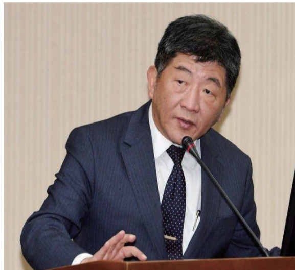
台独分子卫生部负责人 陈时中