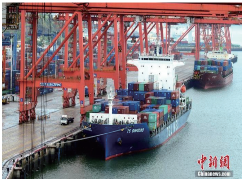
资料图：港口集装箱码头。