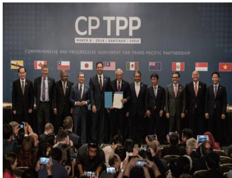
2018年3月8日, 11国代表在智利首都圣地亚哥签署CPTPP。

一是在商品贸易方面, 进一步降低进口关税, 并且尽可能地在谈判中强调中国实行区域的累计原产地标准, 同时做好贸易便利化、投资便利化的工作, 优化营商环境, 减少进口进